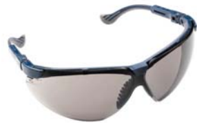
Pulsafe mit Sonnenglas grau Art. Nr. 971.011.025

Anpassbarkeit: Die neue Pulsafe Schutzbrille verfügt über zweifach einstellbare Bügel, so dass ein perfekter Sitz gewährleistet wird. Da der Rahmen extra flexibel ist, fühlt er sich an, wie massgeschneidert und er passt sowohl Damen, als auch Herren. Die Pulsafe ist so komfortabel und leicht, dass diese Schutzbrille sehr gerne getragen wird.