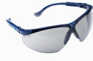
Pulsafe mit Glas klar Art. Nr. 971.010.950